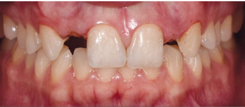
07 Hier ist die Gingiva vor der Konditionierung dargestellt. Die Lücke im ersten Quadranten ist etwas größer als im zweiten.