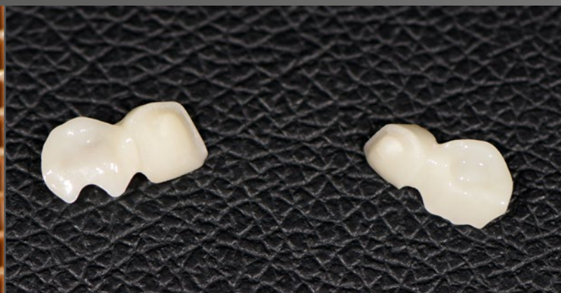
13 Nach dem Brennen (1000 °C) bildet das DCMhotbond zirconnect eine Glasmatrix, die gut auf den Maryland-Brücken zu erkennen ist.