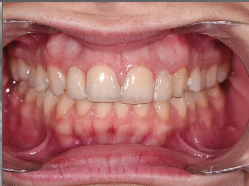
05 & 06 Mithilfe einer Schiene und darin eingearbeiteten Brückengliedern mit idealisierten Basalfläche wurden die Pontics für die endgültige Versorgung konditioniert.