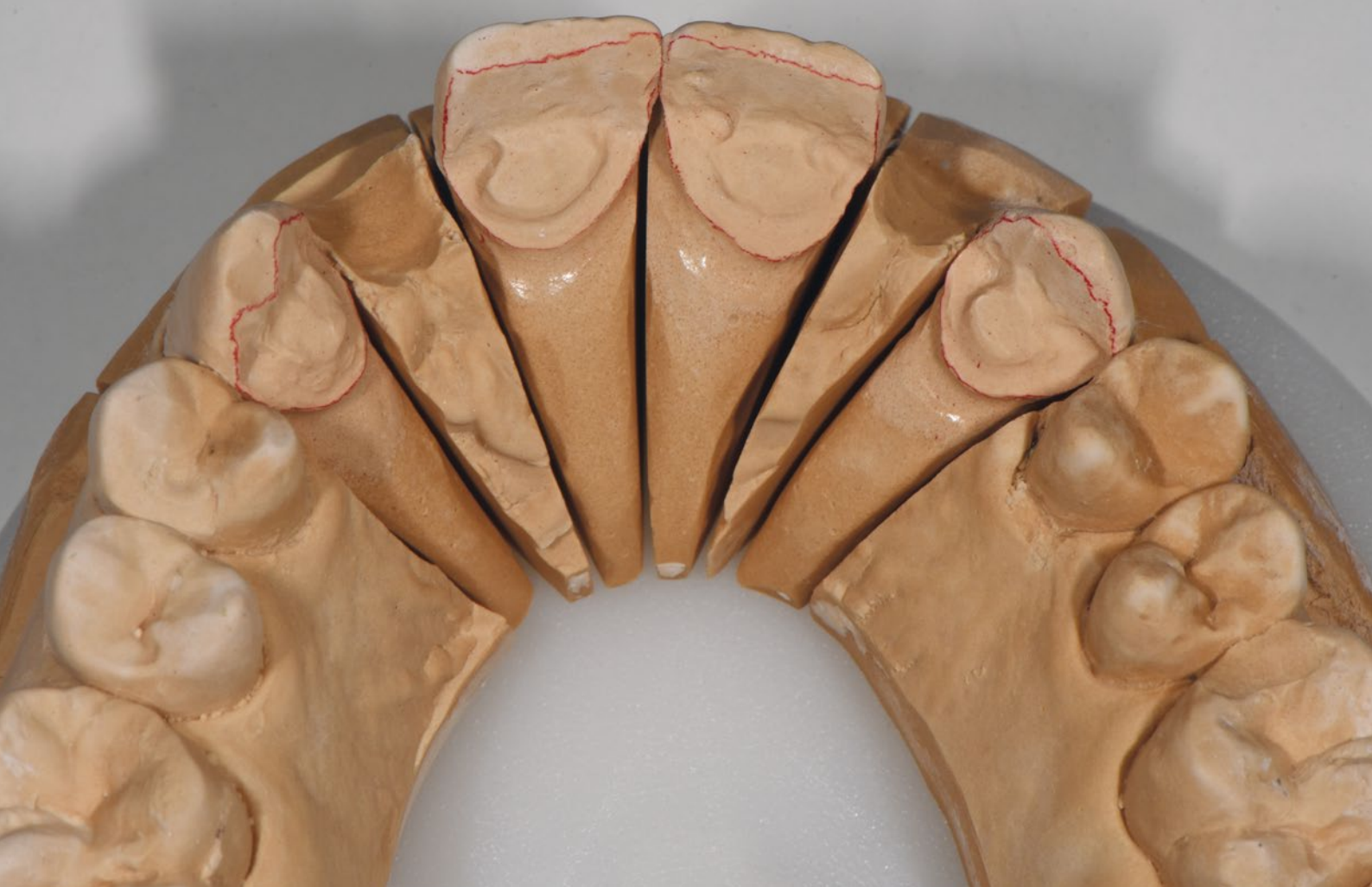
04 Nach der Abnahme der Maryland-Brücken zeigte sich der hohe Substanzverlust an den präparierten Zähnen