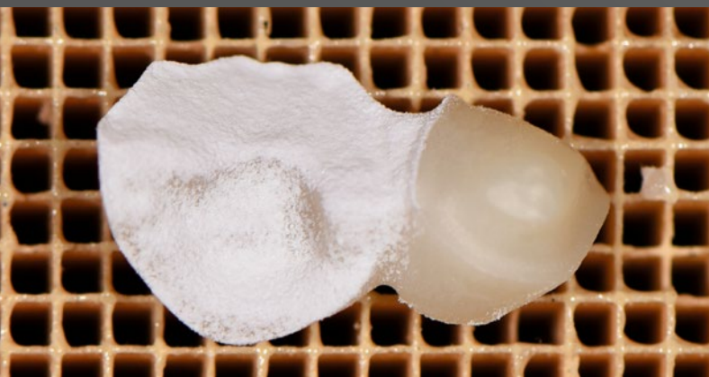
12 Nach dem Abstrahlen der Flügel wurden die späteren Klebeflächen mit DCMhotbond zirconnect eingesprüht.