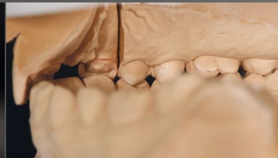
09 - 11 Die Restauration musste aufgrund der Platzverhältnisse sehr filigran angefertigt werden. Für eine ausreichende Stabilität müssen die Verbinder jedoch einen Querschnitt von mindestens 10 mm 2 aufweisen.