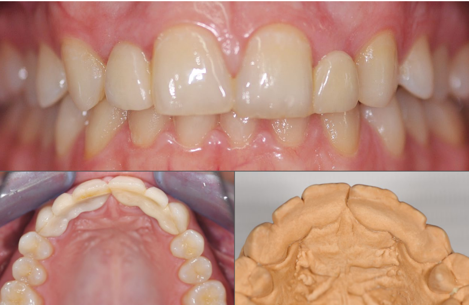
01 – 03 Die Ausgangsvorsorgung der Patientin in situ und auf dem Modell: Die zweiflügeligen Maryland-Brücken hatten sich gelockert, da die Patientin zu einem Zeitpunkt versorgt worden war, da die Zahnentwicklung noch nicht vollständig abgeschlossen war.

Die Vorgeschichte unserer 26-jährigen Patientin: Die seitlichen Schneidezähne waren im definitiven Gebiss nicht angelegt. Demzufolge verschoben sich die Eckzähne immer mehr nach mesial. Im Alter von 13 Jahren wurden ihre Eckzähne kieferorthopädisch wieder in die richtige Position geschoben und circa ein Jahr später mit einer zweiflügeligen Marylandbrücke versorgt ( Abb. 1 bis 3 ). Bei der Präparation wurden damals alle Pfeilerzähne (13, 11, 21 und 23) palatinal beschliffen, sodass der Halt auch im Dentin stattfinden musste ( Abb. 4 ). Zweiflügelige Adhäsivbrücken sollten nur nach vollständig abgeschlossenem Zahndurchbruch eingesetzt werden. Da sich die Patientin noch im Wachstum befand, war ein Scheitern vorprogrammiert.